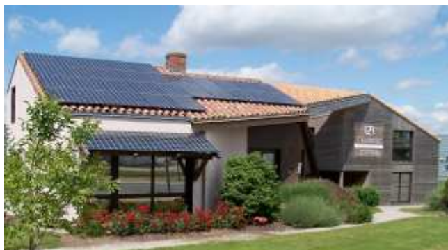
Siège social de la société Qualeader